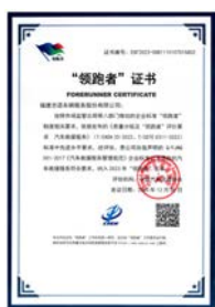
2023汽车救援服务领域 企业标准“领跑者”