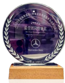
获梅赛德斯-奔驰 “2023年度最佳团队管理奖”