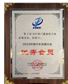
2023年中国汽车流通行业 用户满意度优秀会员