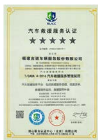
2023年五星救援资质认证