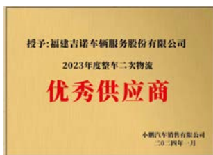
获小鹏汽车 “2023年度优秀供应商”